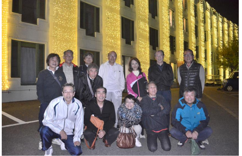
イルミネーション前での集合写真